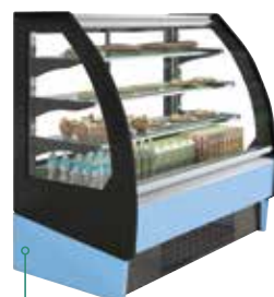
Design 210825 Celeste Sky Blue