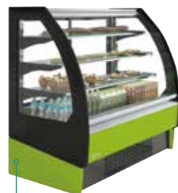
Color exterior Desing 210825 Pistacho / Pistachio