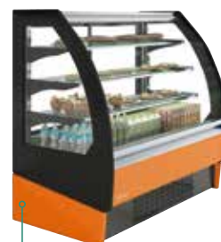
Color exterior Ral 2003 Naranja / Orange