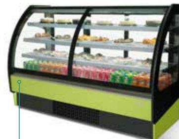
Color exterior Desing 210825 Pistacho / Pistachio