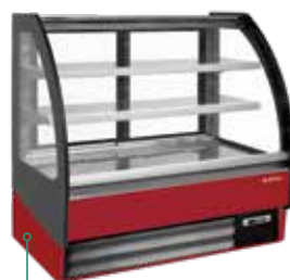
Ral 3003 Granate Maroon