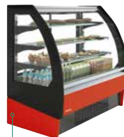
Ral 3020 Rojo Red