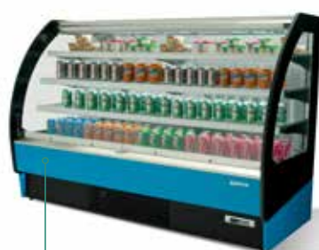
Color exterior Ral 5015 Azul / Blue